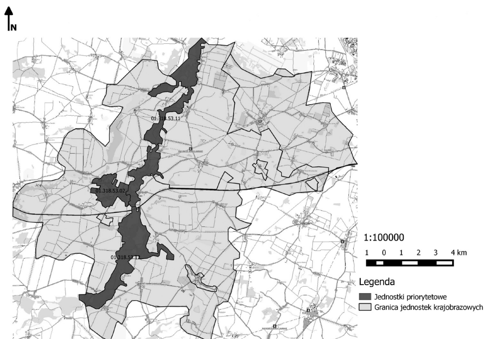
Rysunek 3. Krajobrazy priorytetowe na terenie gminy Kąty Wrocławskie