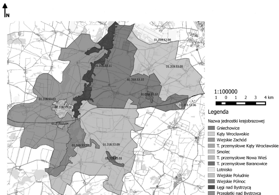
Rysunek 2. Jednostki krajobrazowe na terenie gminy Kąty Wrocławskie